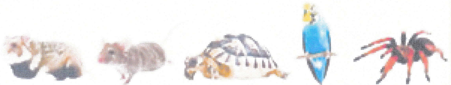
křeček • myš • želva • papoušek • sklipkan