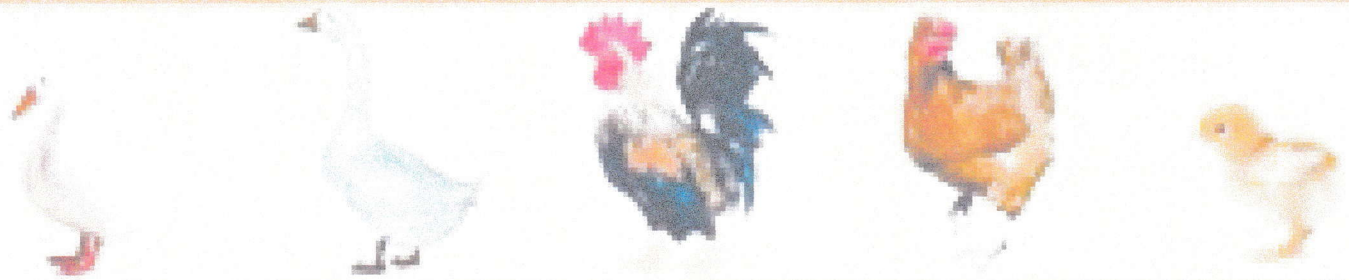
kachna • husa • kohout • slepice • kuře