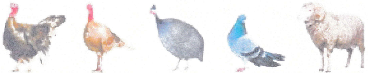
krocan • krůta • perlička • holub • beran